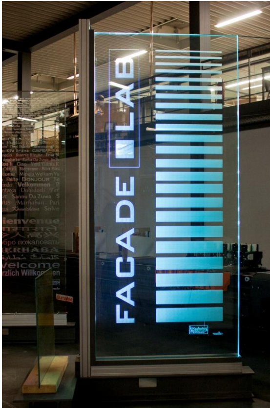
Ansicht Exponat mit seitlicher Beleuchtung Elevation of exponat with lateral illumination